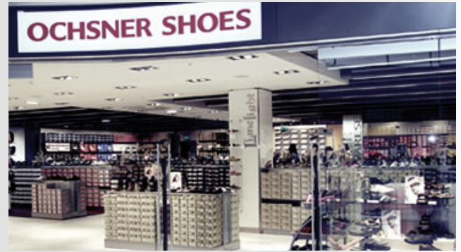
Schweizer Ochsner Filiale

Einweihung des dritten DEICHMANN-Distributionszentrums in Soltau. Erstmals startet DEICHMANN im Ausland seine Expansion unter eigenem Namen – und zwar in Österreich. Im gleichen Jahr übernimmt das Unternehmen die Schweizer Schuhkette OCHSNER.