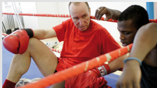
2005 wird der Deichmann-Förderpreis ins Leben gerufen

Der „DEICHMANN-Förderpreis gegen Jugendarbeitslosigkeit“ wird ins Leben gerufen. Mit ihm werden Schulen, Unternehmen oder Initiativen geehrt, die sich gezielt um die Integration benachteiligter Jugendlicher auf dem Arbeits- und Ausbildungsmarkt kümmern. Er wird seitdem jährlich verliehen.