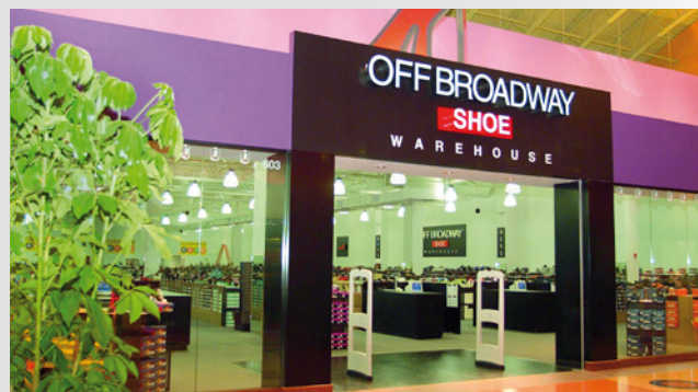
Off Broadway-Filiale in Hazelwood

Übernahme der OFF BROADWAY Group in den USA.