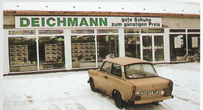
DEICHMANN-Verkaufsstelle in Coswig

In Coswig bei Dresden öffnet die erste DEICHMANN-Verkaufsstelle in den neuen Bundesländern.