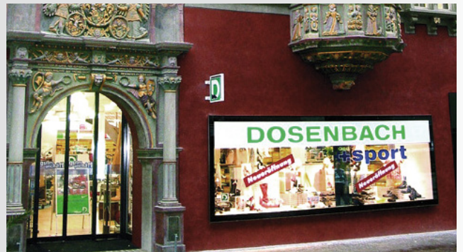
Dosenbach-Filiale in Schaffhausen