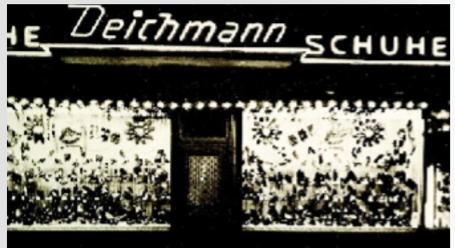
Damalgige Filiale in der Düsseldorfer Ackerstraße