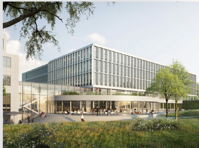
Grafik: bloomimages; gmp Architekten

DEICHMANN blickt nach vorne und gibt ein nachhaltiges Bekenntnis zum Standort Essen ab: Wir erweitern unsere Hauptverwaltung an der Aktienstraße in Essen-Schönebeck und bringen die Bestandsgebäude auf den neuesten Stand. Mit Jahresbeginn 2022 starten die ersten Arbeiten. Herzstück ist ein fünfgeschossiges Atriumgebäude. Der repräsentative Neubau mit Tiefgarage wird zum Entree des Campus und von gepflegten Grünflächen umgeben sein. Der Campus-Umbau für zeitgemäße Arbeitswelten mit hoher Aufenthaltsqualität folgt einem ökologischen Gesamtkonzept, das der aktuellen Entwicklung bei der Energieversorgung und beim Energiemanagement Rechnung trägt.