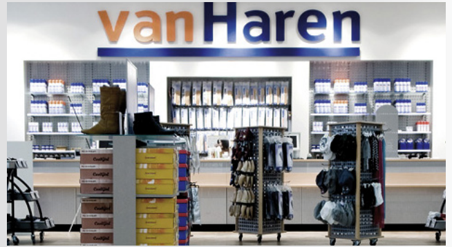
Niederländische vanHaren Filiale