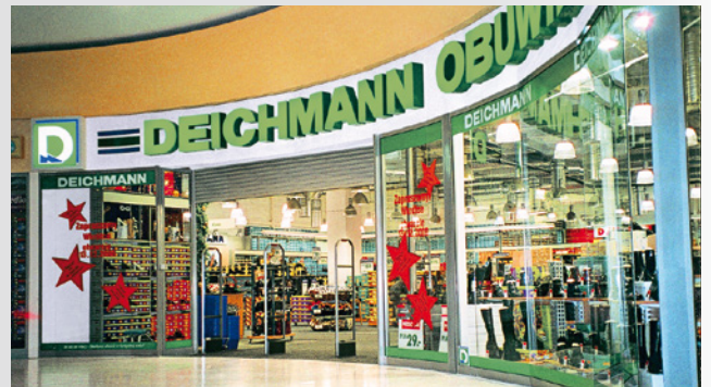
DEICHMANN-Verkaufsstelle in Konin

Im Mai wird die erste DEICHMANN-Verkaufsstelle in Polen in Konin eröffnet.