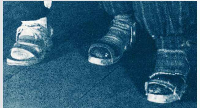
Kurz nach dem Krieg hergestellte Schuhe aus Pappelholz und Fallschirmgurten