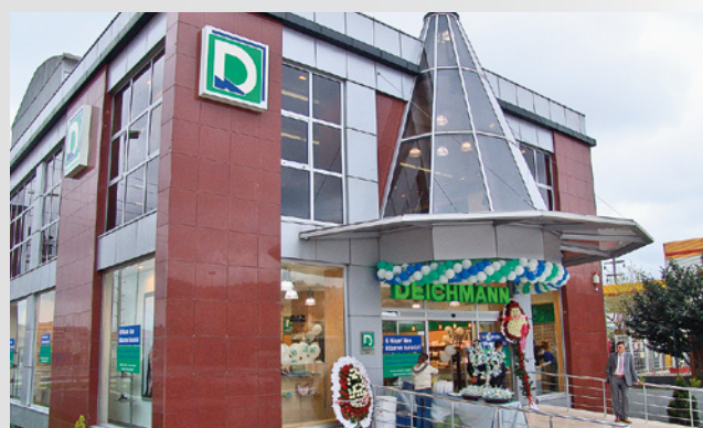
DEICHMANN-Filiale in der Türkei

Eröffnung der ersten DEICHMANN-Filialen in der Türkei und Slowenien.