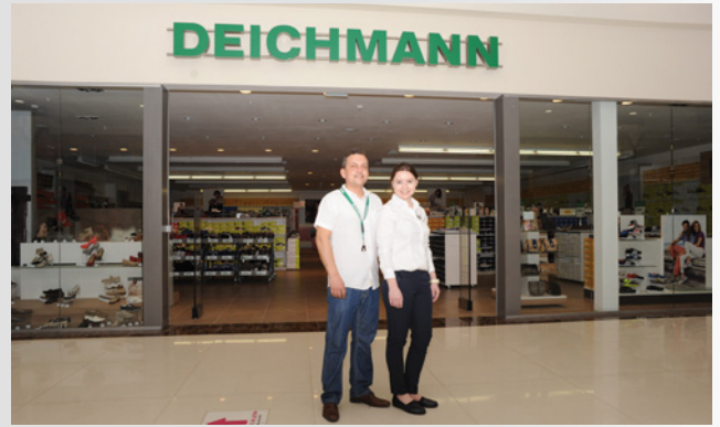
DEICHMANN-Filiale in Russland

Das Unternehmen startet in Russland mit ersten Läden in Moskau und St. Petersburg. In die Frühjahr-/Sommersaison startet DEICHMANN mit dem neuen Claim „Weil wir Schuhe lieben.“