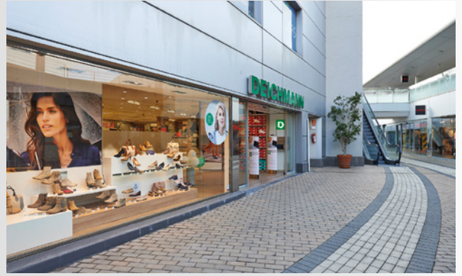
DEICHMANN-Filiale auf Mallorca

DEICHMANN eröffnet seine erste Filiale auf Mallorca. Mittlerweile betreibt die Unternehmensgruppe 25 Onlineshops und entwickelt die Omnichannel-Strategie weiter. U. a. wird der Service „Ship to home“ erstmalig angeboten.