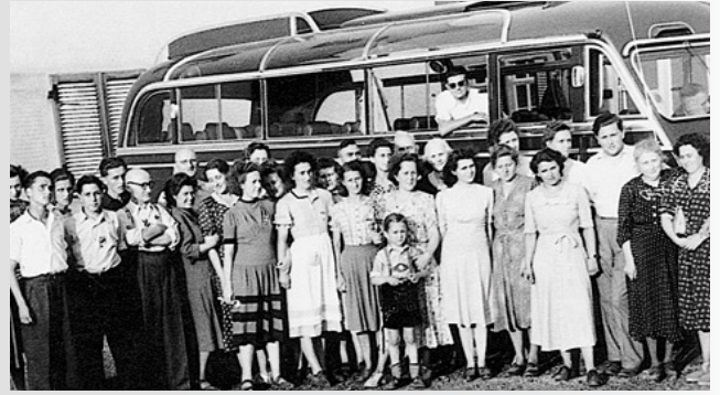
Betriebsausflüge gehören von Anfang an zur Unternehmenskultur dazu.