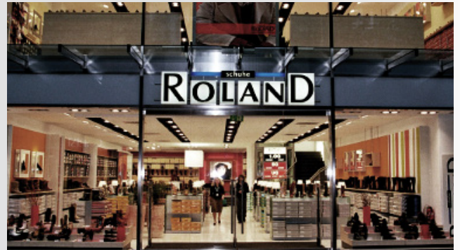
Roland-Filiale in Hamburg

Im 75. Jahr des Bestehens hat DEICHMANN mittlerweile 400 Filialen in Deutschland. Im fränkischen Feuchtswangen wird ein zweites Distributionszentrum eröffnet. Mit der Übernahme der bis dahin ebenfalls inhabergeführten Schuhhandelskette ROLAND kommt ein neuer Name unter das Dach der Firmengruppe. Das Unternehmen, das sich ursprünglich als Herrenschuhanbieter einen Namen gemacht hatte, wird Schritt für Schritt zu einem Vollsortimenter mit modernen Läden in deutschen Großstädten ausgebaut.