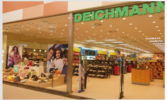
DEICHMANN-Filiale in Italien

Auch in Italien und Litauen startet DEICHMANN mit dem Verkauf.