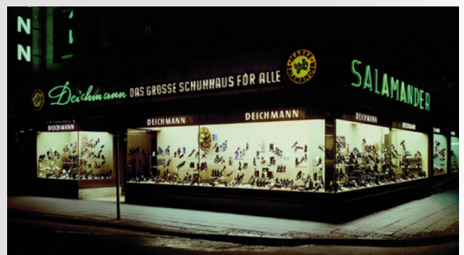
Erste Filiale in Oberhausen

Eröffnung einer DEICHMANN-Filiale in Oberhausen. Heinz-Horst Deichmann sucht nach neuen Wegen in der Ansprache der Kunden. Unter anderem führt er sogenannte „Vorwahlständer“ ein und präsentiert auch Schuhe in der Einkaufspassage. Diese Verkaufspräsentation sah Deichmann kurz zuvor auf der Oxford Street in London. Zudem entwickelt er das bis heute gültige Verkaufsprinzip: DEICHMANN bietet modische Schuhe in guter Qualität zu einem sehr günstigen Preis an. Damit will er breite Käuferschichten erreichen.