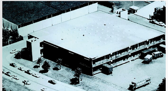
Verwaltungs- und Lagergebäude 1968

Das neue Verwaltungs- und Lagergebäude am Boehnertweg 9 in Essen (heute: Deichmannweg) wird bezogen. Ergänzt durch mehrere Erweiterungsbauten befindet sich hier bis heute die Firmenzentrale.