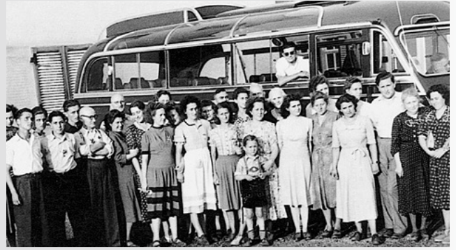
Betriebsausflüge gehören von Anfang an zur Unternehmenskultur dazu.