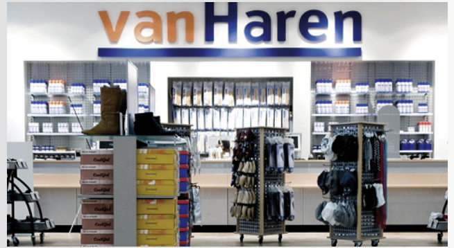
Niederländische vanHaren Filiale