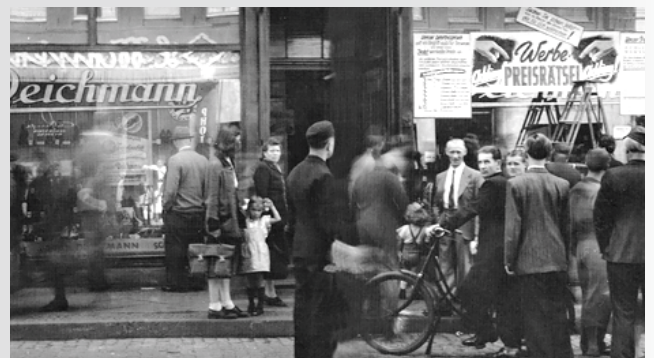
Damalige Filiale am Borbecker Markt

Eröffnung des ersten großen Schuhgeschäfts am Borbecker Markt in Essen.