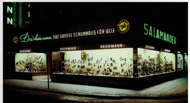
Erste Filiale in Oberhausen

Eröffnung einer DEICHMANN-Filiale in Oberhausen. Heinz-Horst Deichmann sucht nach neuen Wegen in der Ansprache der Kunden. Unter anderem führt er sogenannte „Vorwahlständer“ ein und präsentiert auch Schuhe in der Einkaufspassage. Diese Verkaufspräsentation sah Deichmann kurz zuvor auf der Oxford Street in London. Zudem entwickelt er das bis heute gültige Verkaufsprinzip: DEICHMANN bietet modische Schuhe in guter Qualität zu einem sehr günstigen Preis an. Damit will er breite Käuferschichten erreichen.