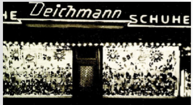
Damalgige Filiale in der Düsseldorfer Ackerstraße