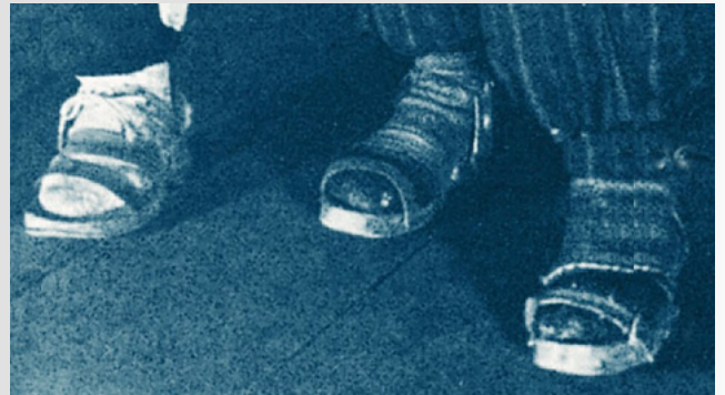
Kurz nach dem Krieg hergestellte Schuhe aus Pappelholz und Fallschirmgurten