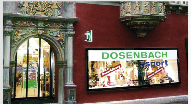
Dosenbach-Filiale in Schaffhausen

Als das traditionsreiche familiengeführte Schweizer Schuhhandelsunternehmen DOSENBACH mangels Nachfolger aus den eigenen Reihen einen Käufer sucht, übernimmt Dr. Heinz-Horst Deichmann die Schuhkette. Er führt sie unter dem angestammten Namen fort und startet damit zum sechzigsten Geburtstag des Unternehmens die internationale Expansion.