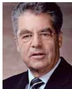
Dr. Heinz Fischer Bundespräsident

A handwritten signature in blue ink, which reads "Heinz Fischer". The signature is written in a cursive, flowing style.