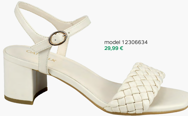
model 12306634 29,99 €

Tejto kombinácii sa nedá odolať. Pre ktorý z modelov sa rozhodnete?