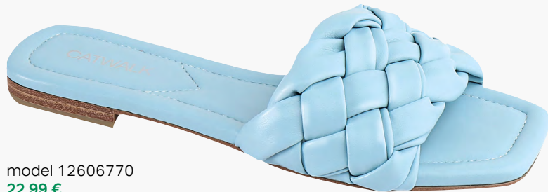
model 12606770 22,99 €