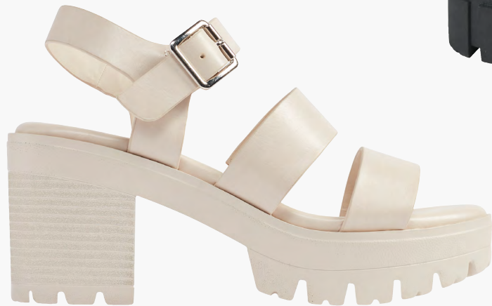
model 12406820 34,99 €