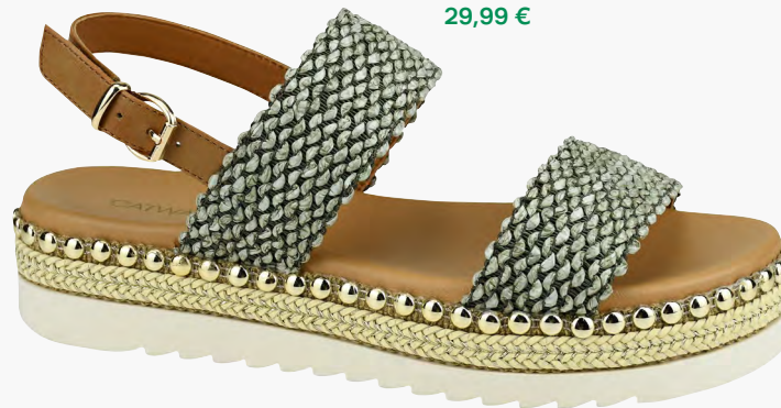
model 12206280 29,99 €