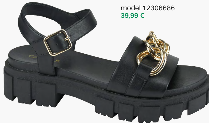
model 12306686 39,99 €