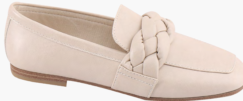
model 11446840 29,99 €