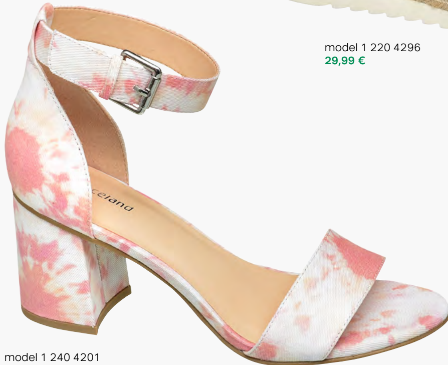
model 1 240 4201 27,99 €