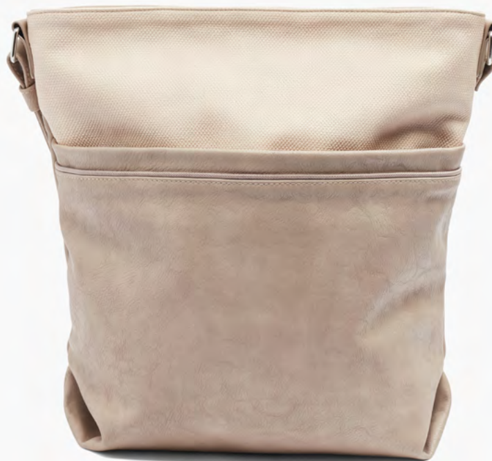
model 4 100 4270 22,99 €

..... Skvelá voľba na prechádzky po meste...