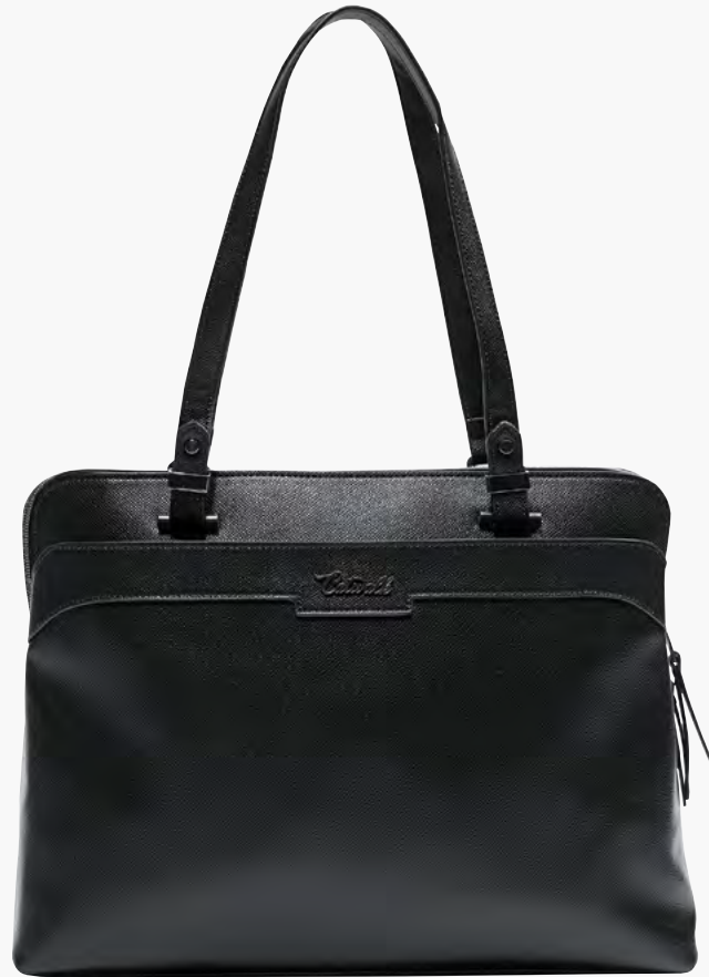
model 4 101 4410 27,99 €