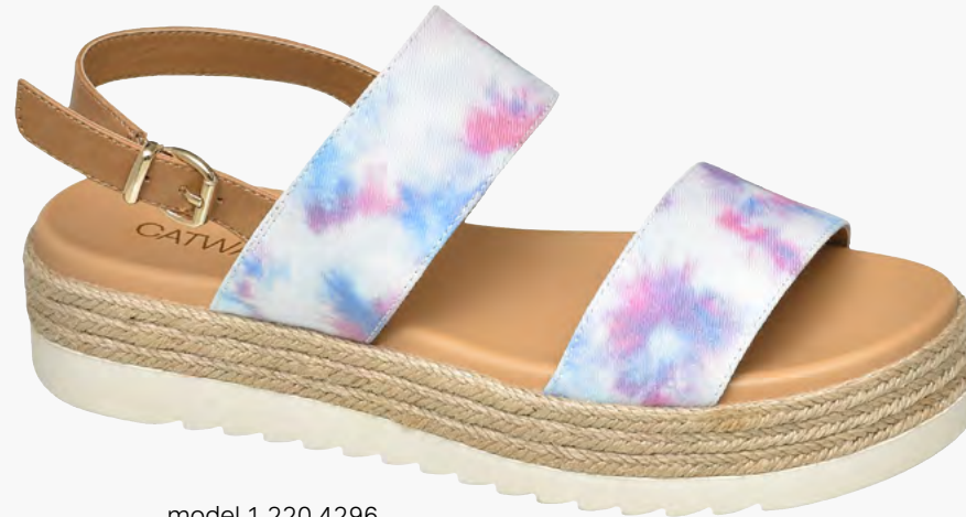
model 1 220 4296 29,99 €