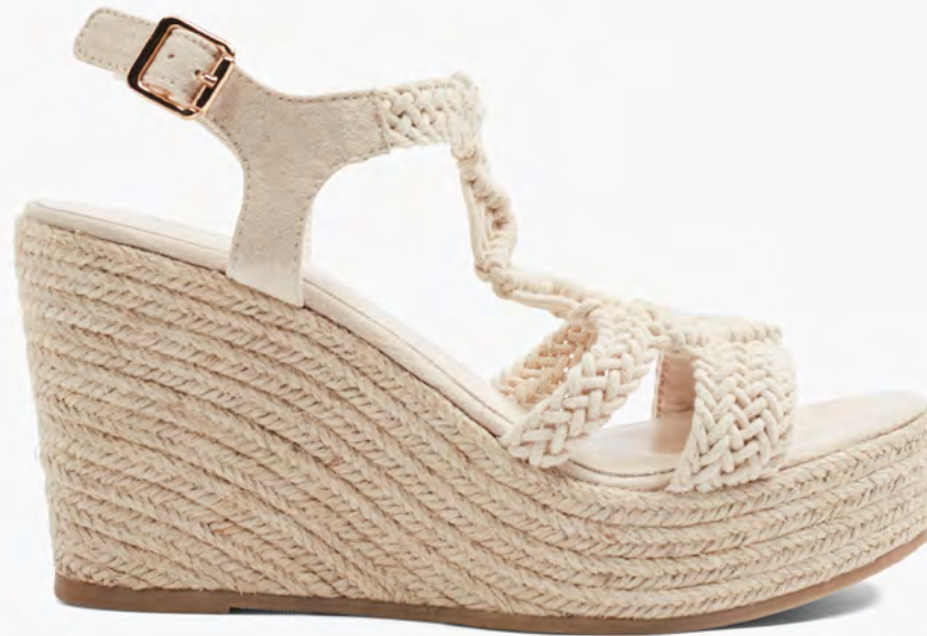
model 1 240 4410 29,99 €

Vďaka svetlým tónom perfektne zvýrazníte svoju krásne opálenú pokožku...