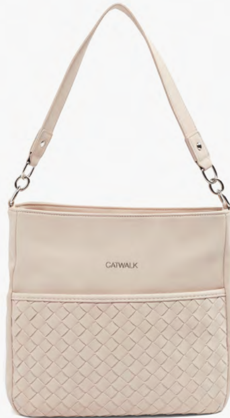
model 4 101 4290 27,99 €