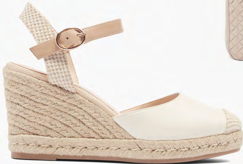
model 1 174 4770 27,99 €

Pretože leto a sandáliky na klinovom podpätku k sebe skrátka patria...