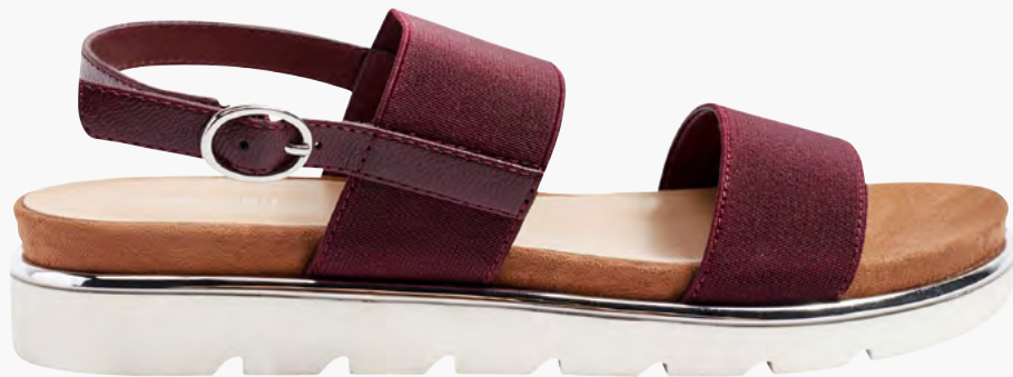
model 1 220 4041 27,99 €