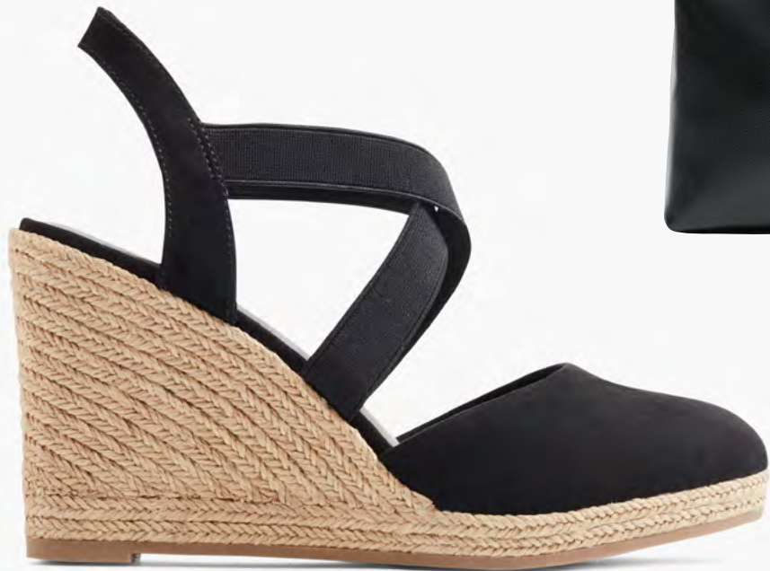
model 1 170 4140 27,99 €

..... Stavte na eleganciu aj v horúcich letných dňoch...