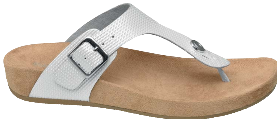
Model 1 261 000 16,90 €