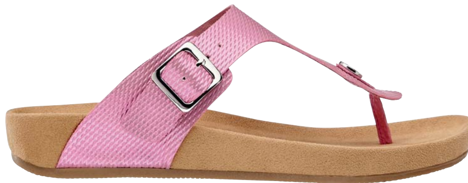
Model 1 261 002 16,90 €

Komfortné stielky budú rozmaznávať vaše chodidlá...