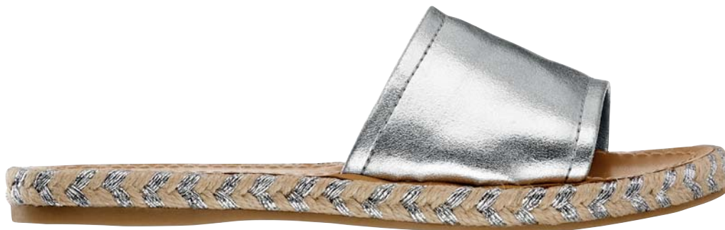
Model 1260 035 16,90 €

Šlapky a žabky sú skvelým doplnkom na pláž aj na terasu reštaurácie...