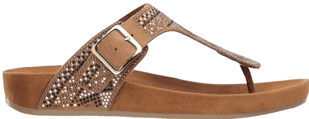
Model 1261 010 22,90 €