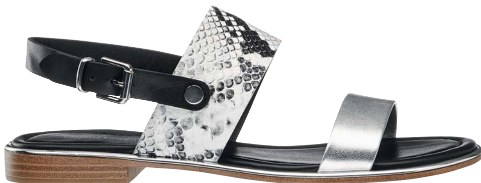
Model 1 210 956 19,90 €