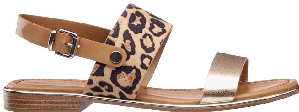
Model 1 210 955 19,90 €

Sandále so zvieracími vzormi z vás urobia skutočnú superstar...