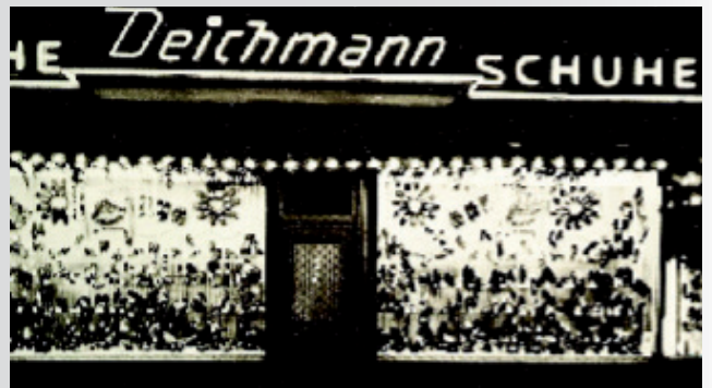
Az akkori Deichmann üzlet a düsseldorfi Acker utcában.

Időközben már Düsseldorfban tanul és megnyitja az első Deichmann üzletet Essenen kívül. A cipőket saját maga szállítja az utazásai során. Az üzletet az édesanyja vezeti.