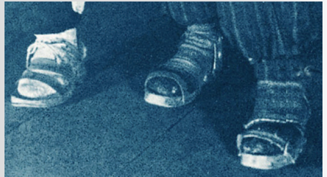
Röviddel a háború után előállított cipők nyárfából és ejtóernyő zsinórokból.