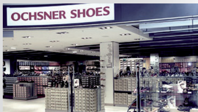
Svájci Ochsner Shoes üzlet.

Már Ausztriában is lehet Deichmann cipőket venni. Ezzel párhuzamosan a vállalat átveszi a svájci Ochsner cipőkereskedelmi láncot.