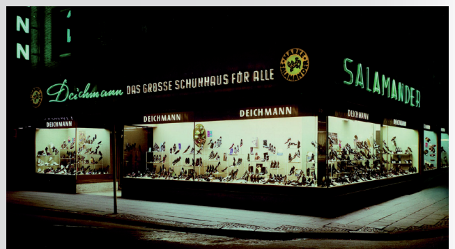
Az első üzlet Oberhausenben.

A harmadik Deichmann üzlet Oberhausenben nyílik és Heinz-Horst Deichmann felméri a vevők igényeit, hogy fejlessze a kínálatát. Többek között úgy nevezett forgóállványokat szerez be, hogy a cipőket az üzlet előtt is prezentálhassa. Kifejlesztette a máig érvényes eladási elvet. A Deichmann divatos cipőket kínál jó minőségben, nagyon jó áron. Ezáltal széles vásárlói rétegeket megcélozva.