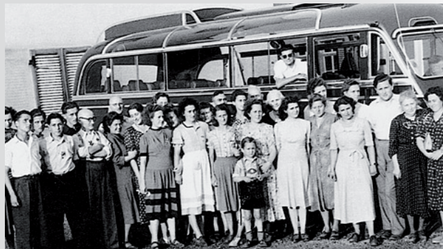
A céges kirándulások már a kezdetektől a vállalati kultúrához tartoznak.