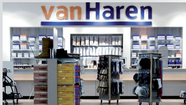
Holland vanHaren üzlet.