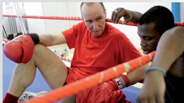
2005-ben életre lett hívva a támogatói díj.

A DEICHMANN-támogatói díj a fiatalok munkanélkülisége ellen" alapítása. Iskolákat, vállalatokat, kezdeményezőket tüntet ki, akik a munkaerő- és képzési piacon célzottan foglalkoznak a hátrányos helyzetű fiatalok integrációjával. Azóta évente kerül átadásra.