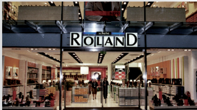
Roland üzlet Hamburgban.

A 75. születésnapján a Deichmann már 400 üzlettel rendelkezik Németországban. Feuchtwangen-ben egy második elosztóközpont nyílik. A Roland cipővállalat átvételével egy újabb tulajdonos által vezetett lánc kerül a cégcsoport égisze alá. A vállalat, amely eredetileg férficipőket kínált, lépésről lépésre teljes szortimentre tér át az üzletek modernizálásával a német nagyvárosokban.