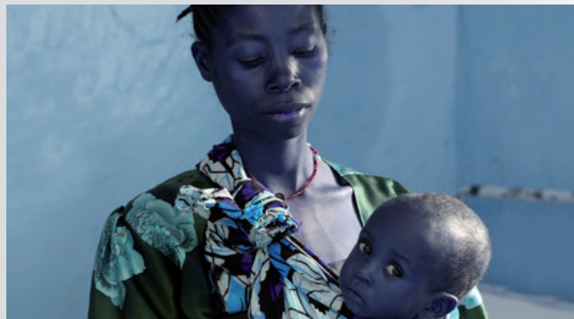
Orvosi segélyprojekt Kiama-ban.

A 800. üzlet nyitása Dessauban. Dr. Deichmann Tanzánia déli részén az afrikai bozót közepén megkezdí egy orvosi segélyprojekt felépítését