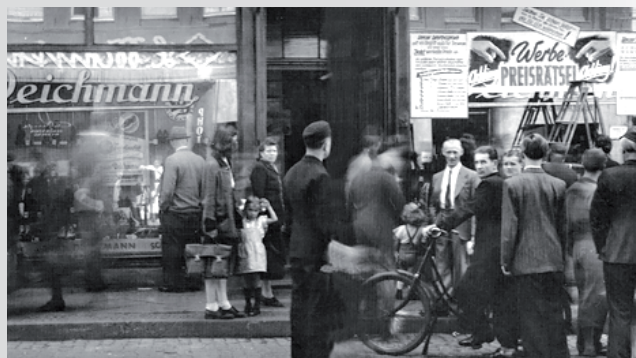
Az akkori üzlet a borbecki piacnál.

A cipésműhely és az üzlet közvetlenül a borbecki piachoz költözik a Borbecker utca 129-be.