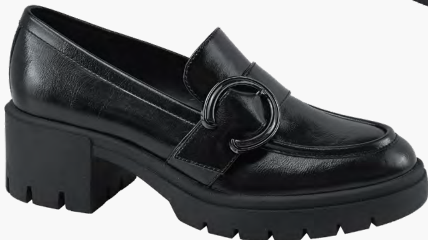
model 1140 2260 799 Kč