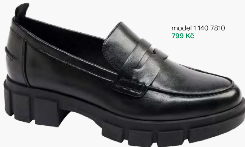
model 1140 7810 799 Kč

Nebojte se vyniknout v lakovaných mokasínách s robustní podešví.