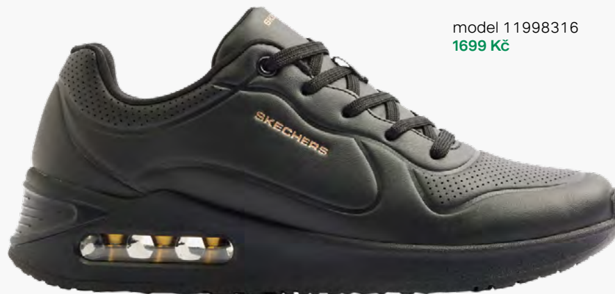
model 11998316 1699 Kč

Ať už černé nebo bílé, ležérní tenisky vnesou do volnočasového outfitu styl.