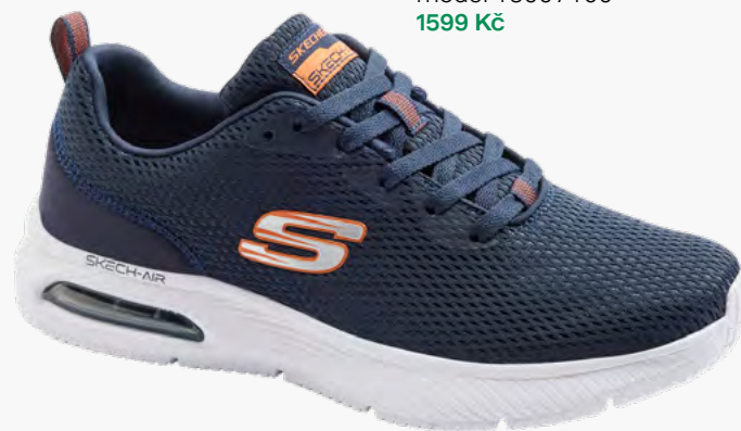
model 13997100 1599 Kč