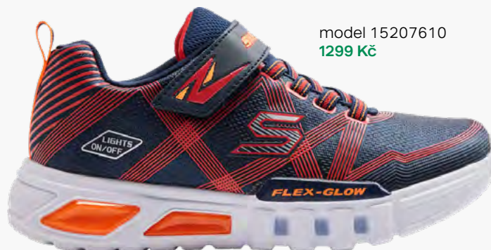
model 15207610 1299 Kč