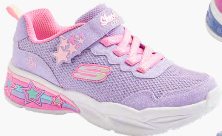
model 15308670 1299 Kč

Dívčí tenisky značky Skechers jsou toho jasným důkazem.