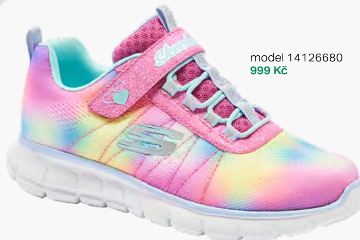
model 14126680 999 Kč