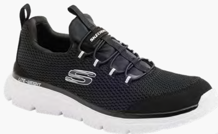
model 13998053 1399 Kč

Na běh, do posilovny, do kanceláře. Skechers tenisky jsou prostě multifunkční.