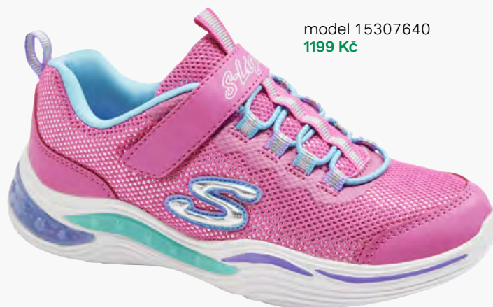
model 15307640 1199 Kč