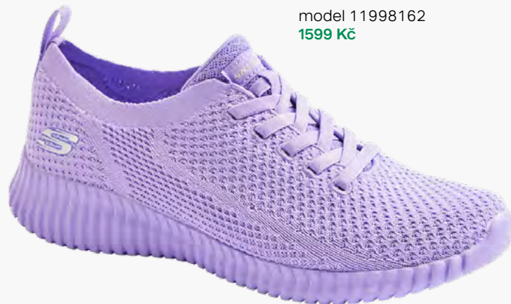
model 11998162 1599 Kč