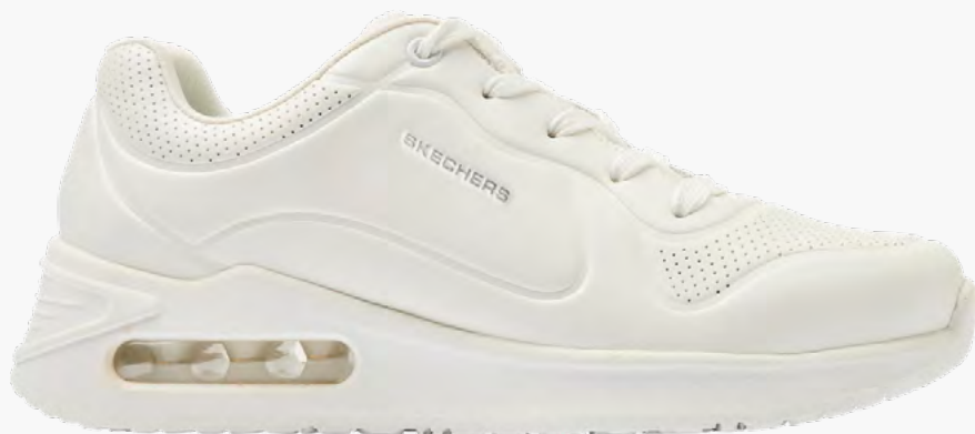
model 11998300 1699 Kč