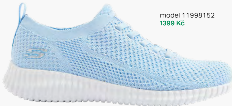
model 11998152 1399 Kč