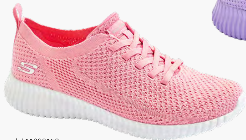
model 11998150 1399 Kč

Takové je nejen jaro, ale i slip-on tenisky značky Skechers. Vyjděte jaru naproti v nových teniskách.