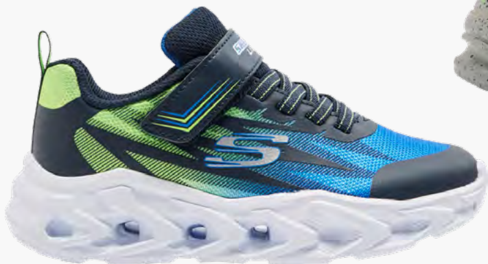
model 15206610 1199 Kč

Odlehčené, praktické a navíc cool - takové jsou chlapecké Skechers tenisky.