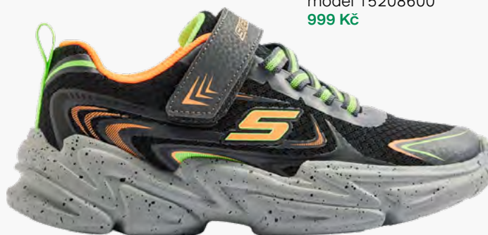
model 15208600 999 Kč