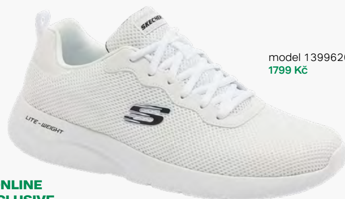
model 13996208 1799 Kč