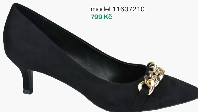
model 11607210 799 Kč