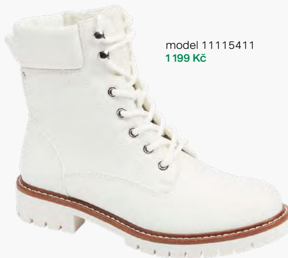
model 11115411 1199 Kč