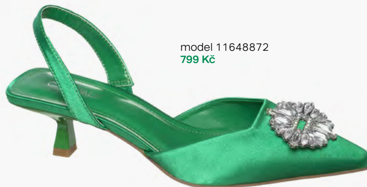
model 11648872 799 Kč