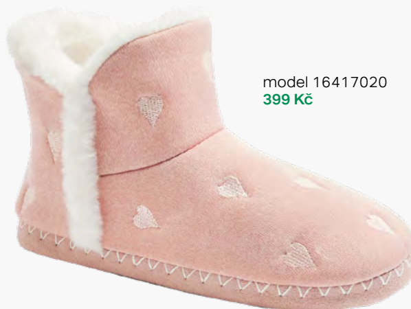
model 16417020 399 Kč