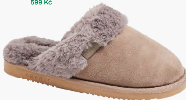
model 16407312 599 Kč