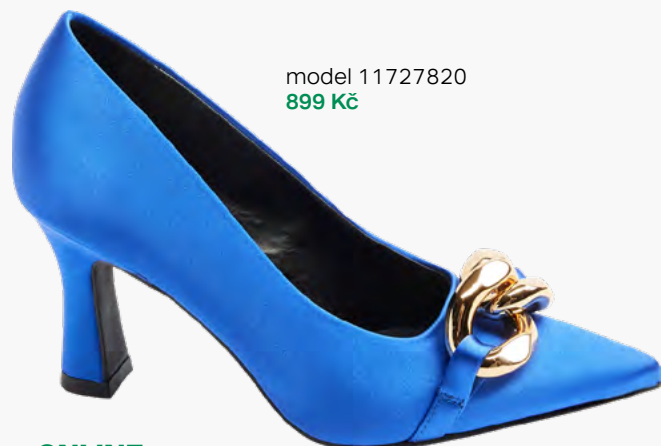
model 11727820 899 Kč

V elegantních lodičkách na nízkém podpatku protančíte nejdén večírek.