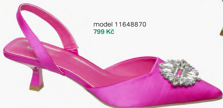
model 11648870 799 Kč

Vsad'te na půvabné slingback lodičky vyšperkované do posledního detailu.