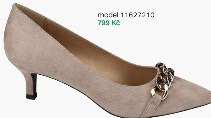
model 11627210 799 Kč