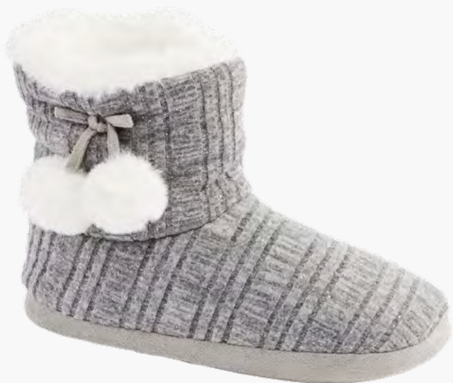
model 16411064 399 Kč

Není nad sváteční domácí pohodu v plyšových papučkách.