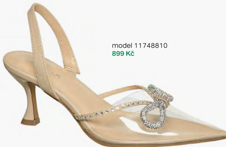
model 11748810 899 Kč