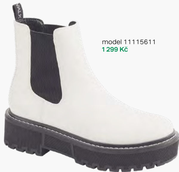
model 11115611 1299 Kč

Nebojte se bílé! Je trendy a oživí nejen sváteční outfit.