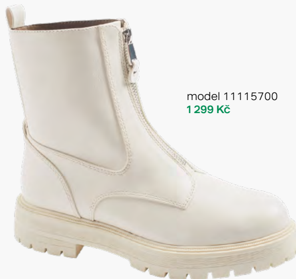
model 11115700 1299 Kč