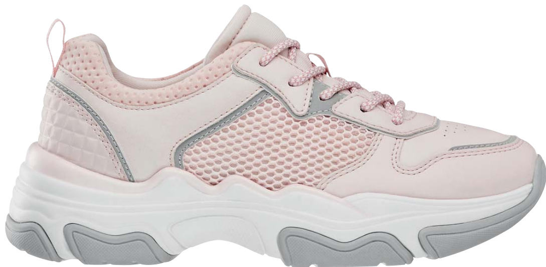
Model 1 103 033 999 Kč