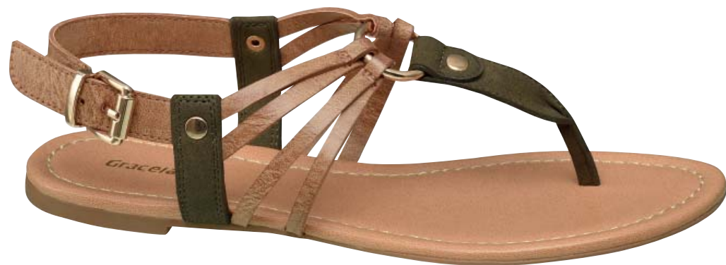
Model 1 210 050 499 Kč

Sandály budou díky zajímavým detailům pastvou pro oči...