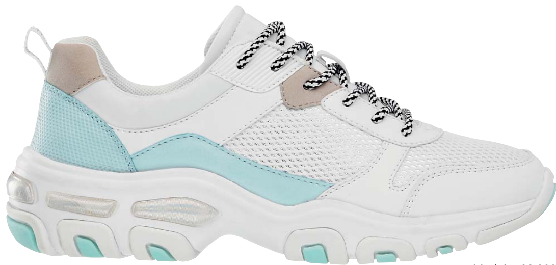
Model 1 103 028 849 Kč

Sportovní tenisky obhajují titul nejoblíbenější jarní obuvi...