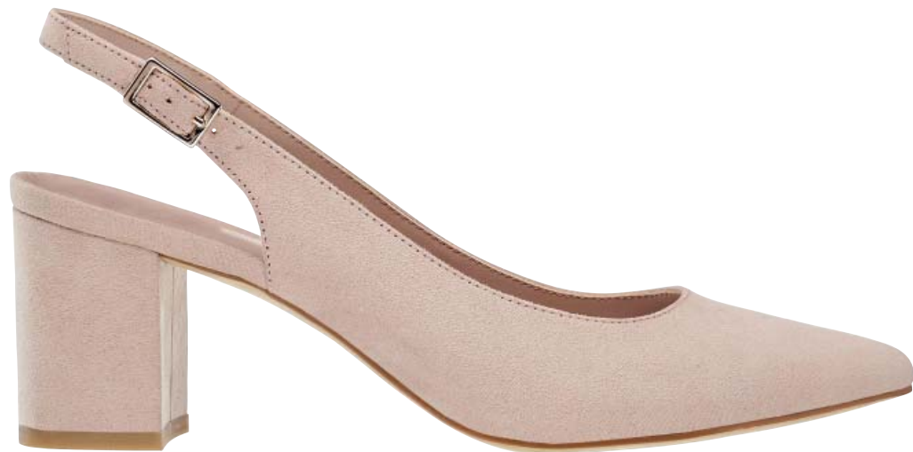
Model 1164 050 649 Kč

Pokud si netroufnete na jehly, zvolte decentnější model s nádechem nostalgie...