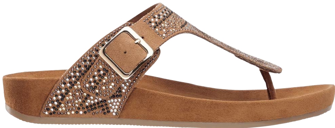
Model 1 261 010 649 Kč