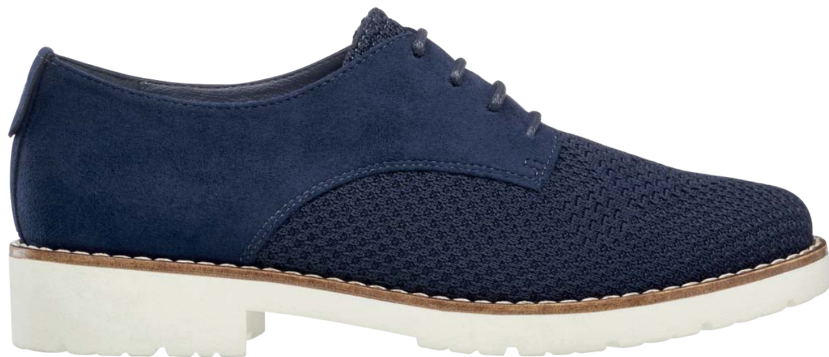
Model 1 144 052 849 Kč