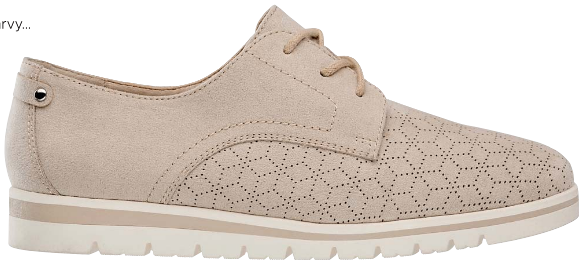
Model 1 144 055 699 Kč

Šněrovací obuvi sluší čistý design a pestré barvy...