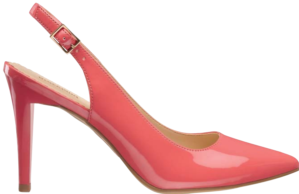
Model 1174 018 699 Kč

Elegantní podpatky vám přidají centimetry i sebevědomí...