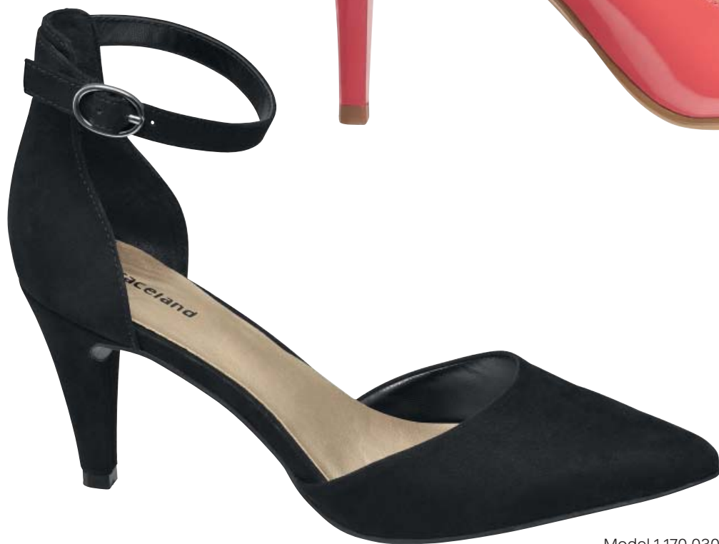
Model 1170 030 649 Kč