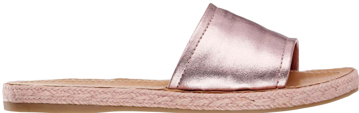
Model 1 260 036 499 Kč

Je líbo metalické nebo s kamínky? Pantofle si nás získaly na první obutí...