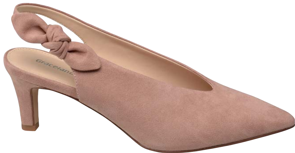
Model 1164 040 599 Kč