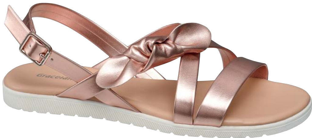
Model 1 210 025 599 Kč