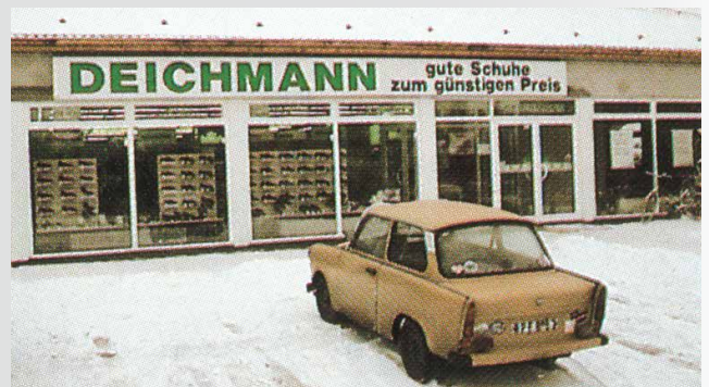
DEICHMANN-Verkaufsstelle in Coswig

In Coswig bei Dresden öffnet die erste DEICHMANN-Verkaufsstelle in den neuen Bundesländern.