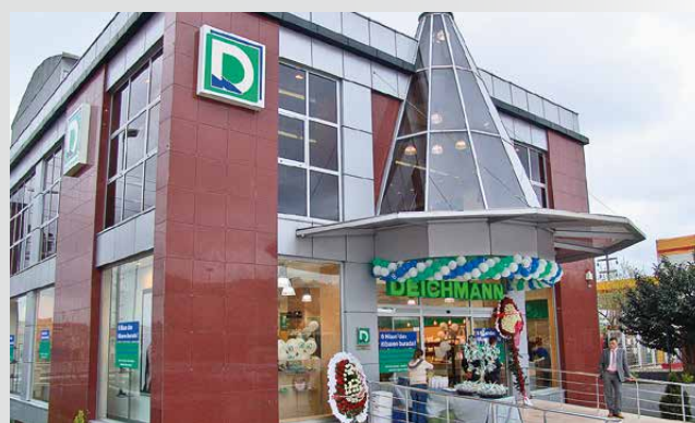
DEICHMANN-Filiale in der Türkei

Eröffnung der ersten DEICHMANN-Filialen in der Türkei und Slowenien.