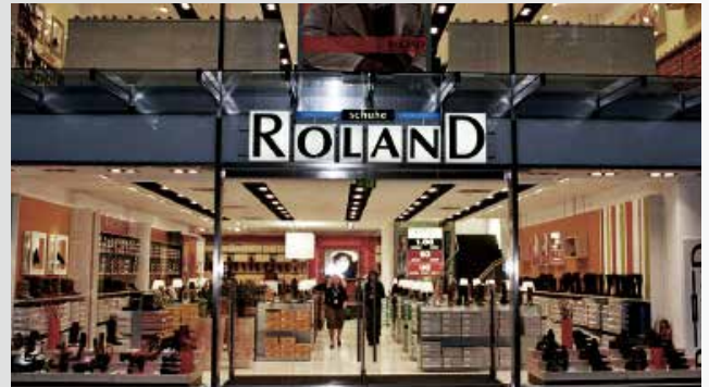
Roland-Filiale in Hamburg

Im 75. Jahr des Bestehens hat DEICHMANN mittlerweile 400 Filialen in Deutschland. Im fränkischen Feuchtswangen wird ein zweites Distributionszentrum eröffnet. Mit der Übernahme der bis dahin ebenfalls inhabergeführten Schuhhandelskette ROLAND kommt ein neuer Name unter das Dach der Firmengruppe. Das Unternehmen, das sich ursprünglich als Herrenschuhanbieter einen Namen gemacht hatte, wird Schritt für Schritt zu einem Vollsortimenter mit modernen Läden in deutschen Großstädten ausgebaut.