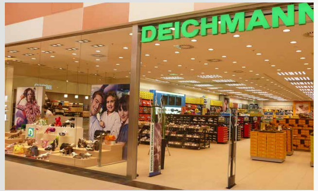
DEICHMANN-Filiale in Italien

Auch in Italien und Litauen startet DEICHMANN mit dem Verkauf.