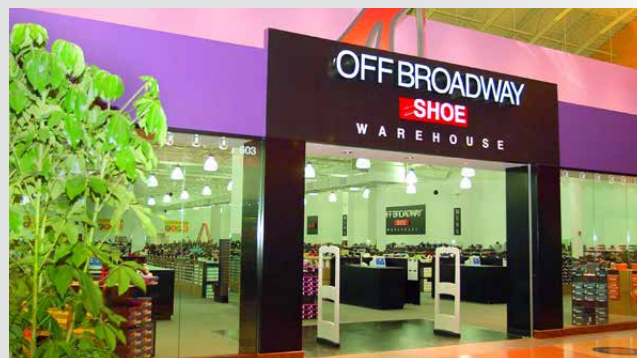
Off Broadway-Filiale in Hazelwood

Übernahme der OFF BROADWAY Group in den USA.