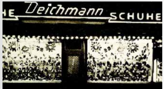
Damalgige Filiale in der Düsseldorfer Ackerstraße