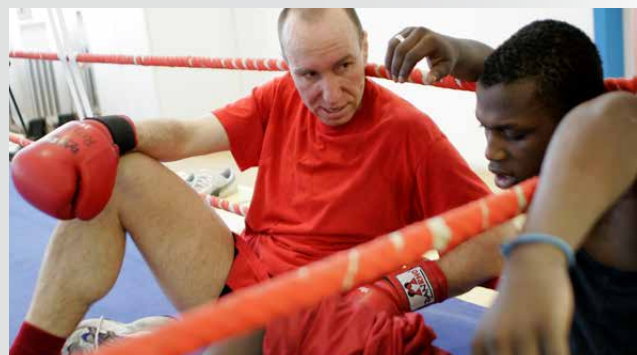
2005 wird der Deichmann-Förderpreis ins Leben gerufen

Der „DEICHMANN-Förderpreis gegen Jugendarbeitslosigkeit“ wird ins Leben gerufen. Mit ihm werden Schulen, Unternehmen oder Initiativen geehrt, die sich gezielt um die Integration benachteiligter Jugendlicher auf dem Arbeits- und Ausbildungsmarkt kümmern. Er wird seitdem jährlich verliehen.