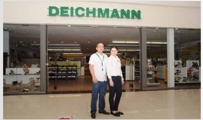
DEICHMANN-Filiale in Russland

Das Unternehmen startet in Russland mit ersten Läden in Moskau und St. Petersburg. In die Frühjahr-/Sommersaison startet DEICHMANN mit dem neuen Claim „Weil wir Schuhe lieben.“