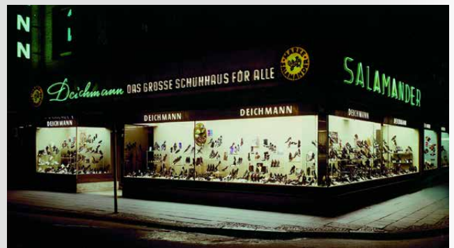
Erste Filiale in Oberhausen

Eröffnung einer DEICHMANN-Filiale in Oberhausen. Heinz-Horst Deichmann sucht nach neuen Wegen in der Ansprache der Kunden. Unter anderem führt er sogenannte „Vorwahlständler“ ein und präsentiert auch Schuhe in der Einkaufspassage. Diese Verkaufspräsentation sah Deichmann kurz zuvor auf der Oxford Street in London. Zudem entwickelt er das bis heute gültige Verkaufsprinzip: DEICHMANN bietet modische Schuhe in guter Qualität zu einem sehr günstigen Preis an. Damit will er breite Käuferschichten erreichen.