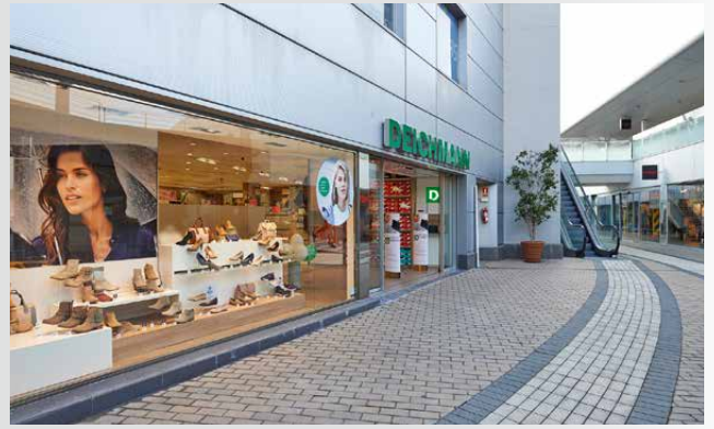
DEICHMANN-Filiale auf Mallorca

DEICHMANN eröffnet seine erste Filiale auf Mallorca. Mittlerweile betreibt die Unternehmensgruppe 25 Onlineshops und entwickelt die Omnichannel-Strategie weiter. U. a. wird der Service „Ship to home“ erstmalig angeboten.