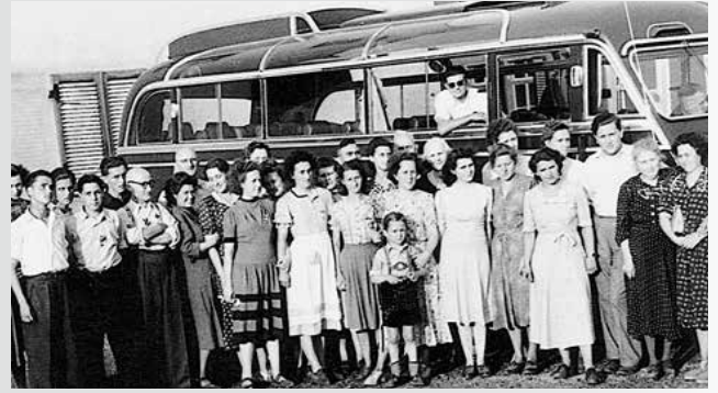
Betriebsausflüge gehören von Anfang an zur Unternehmenskultur dazu.