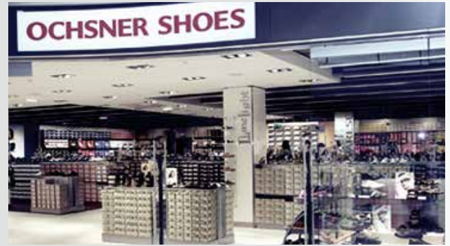
Schweizer Ochsner Filiale

Einweihung des dritten DEICHMANN-Distributionszentrums in Soltau. Erstmals startet DEICHMANN im Ausland seine Expansion unter eigenem Namen – und zwar in Österreich. Im gleichen Jahr übernimmt das Unternehmen die Schweizer Schuhkette OCHSNER.