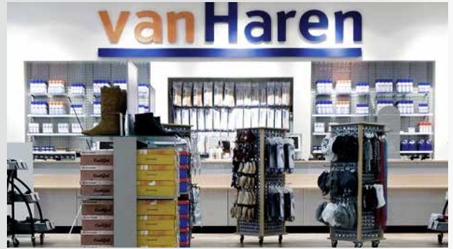
Niederländische vanHaren Filiale