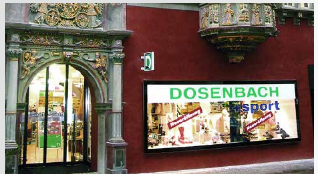
Dosenbach-Filiale in Schaffhausen