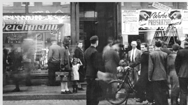
Damalige Filiale am Borbecker Markt

Eröffnung des ersten großen Schuhgeschäfts am Borbecker Markt in Essen.