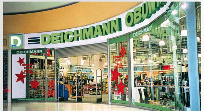
DEICHMANN-Verkaufsstelle in Konin

Im Mai wird die erste DEICHMANN-Verkaufsstelle in Polen in Konin eröffnet.