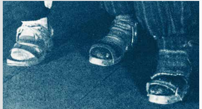
Kurz nach dem Krieg hergestellte Schuhe aus Pappelholz und Fallschirmgurten