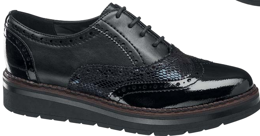
Model 1 140 774 26,90 €