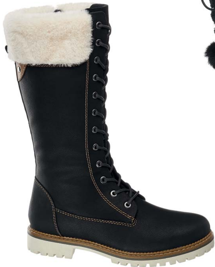
Model 1114 770 44,90 €

(Ne)nechajte sa zošnúrovať a užite si hravé brmbolce alebo štýlovú kožušinu...