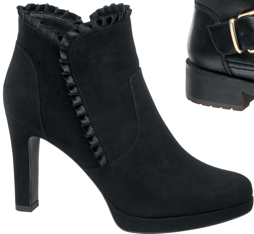
Model 1 110 787 34,90 €

Chcete byť dnes za dámu alebo rockerku? Členková obuv dokáže oboje...