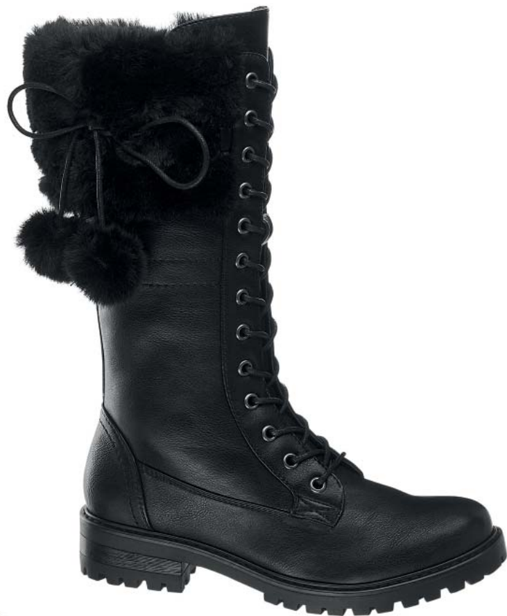
Model 1114 773 44,90 €