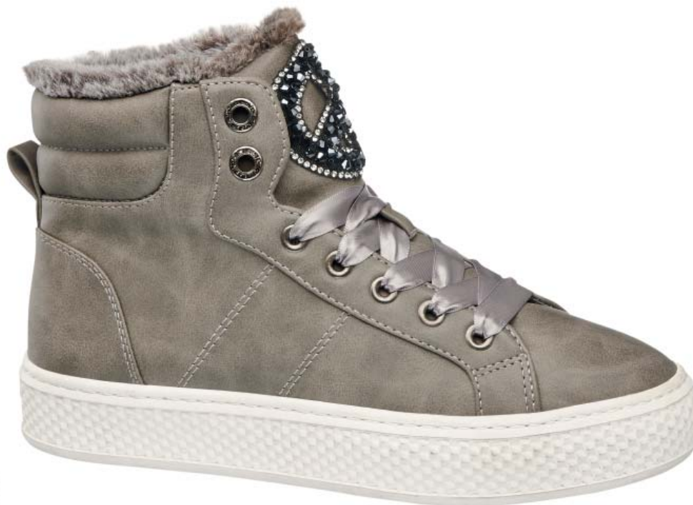
Model 1 103 740 29,90 €

Milovníci tenisiek sa svojej obľúbenej obuvi nemusia vzdávať ani v zime...