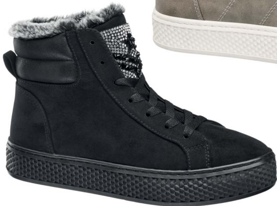
Model 1 103 744 29,90 €