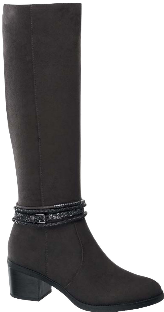
Model 1 116 720 39,90 €

Ozdobné remienky, výška nad kolená – zima nám chystá príjemné prekvapenia...