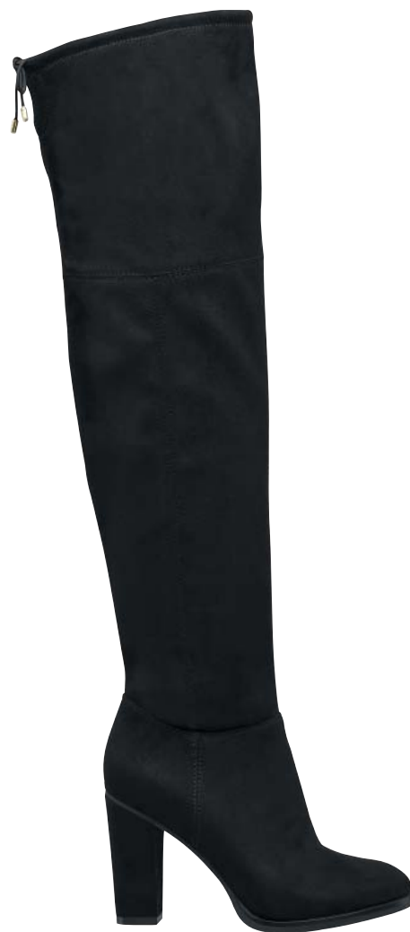
Model 1 115 540 44,90 €