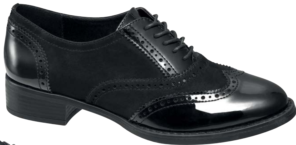
Model 1 150 764 24,90 €

Poltopánky v lakovanom vzhľade rozohrávajú hru svetiel a tieňov...