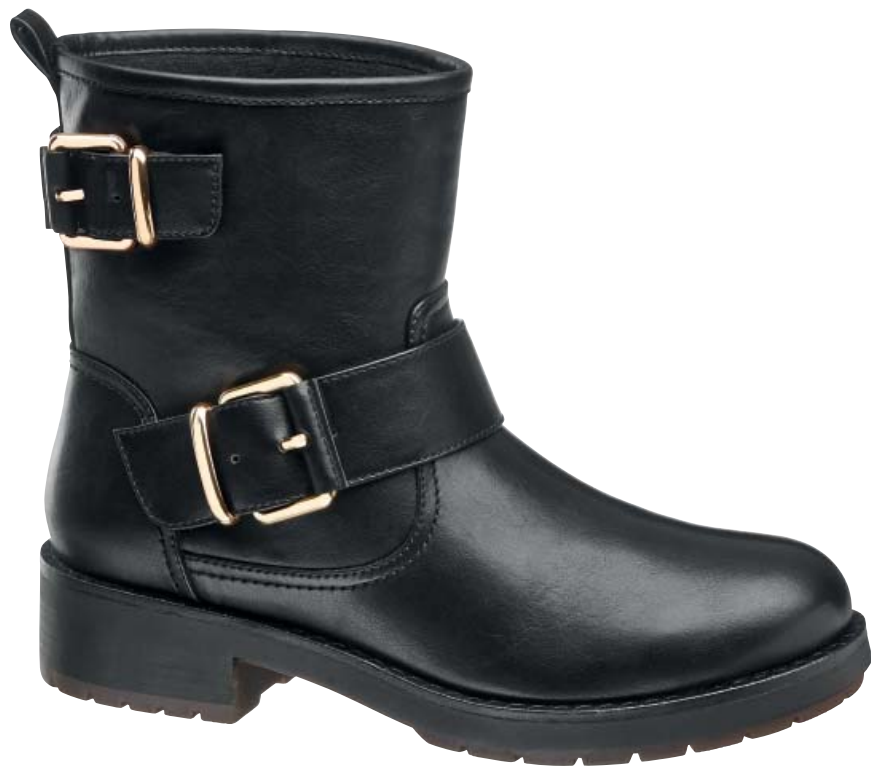
Model 1 111 718 34,90 €