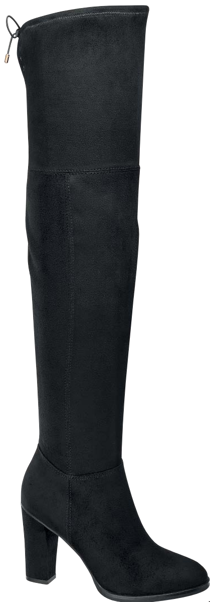
Model 1 115 540 1299 Kč

Oblíbené kozačky nad kolena jsou svůdné a plné vášně...