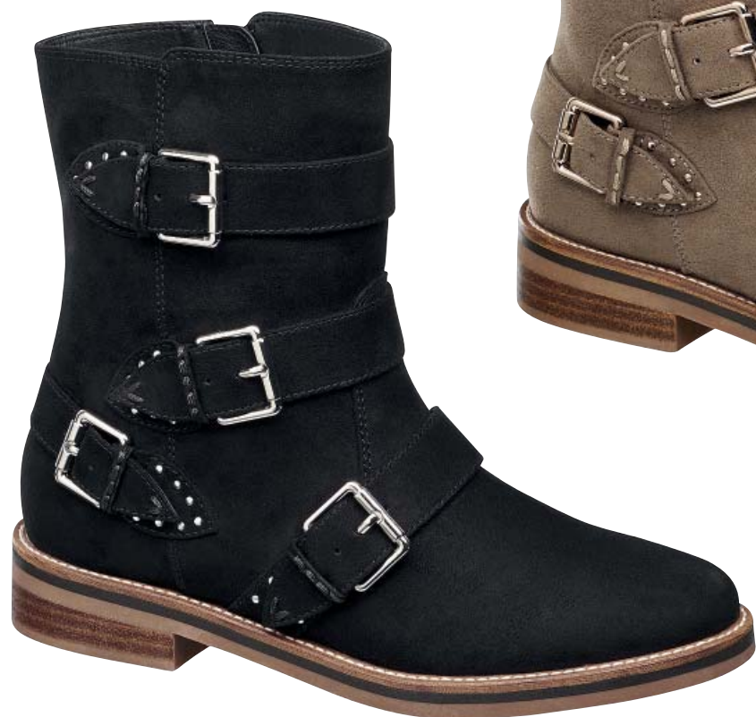
Model 1 110 522 999 Kč

Nízké kozačky mají šmrnc díky aplikacím v podobě kovových přezek...