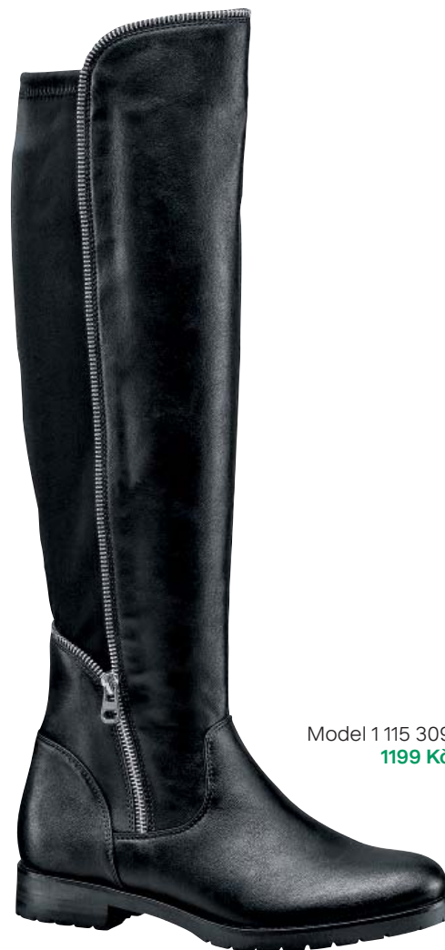
Model 1 115 309 1199 Kč