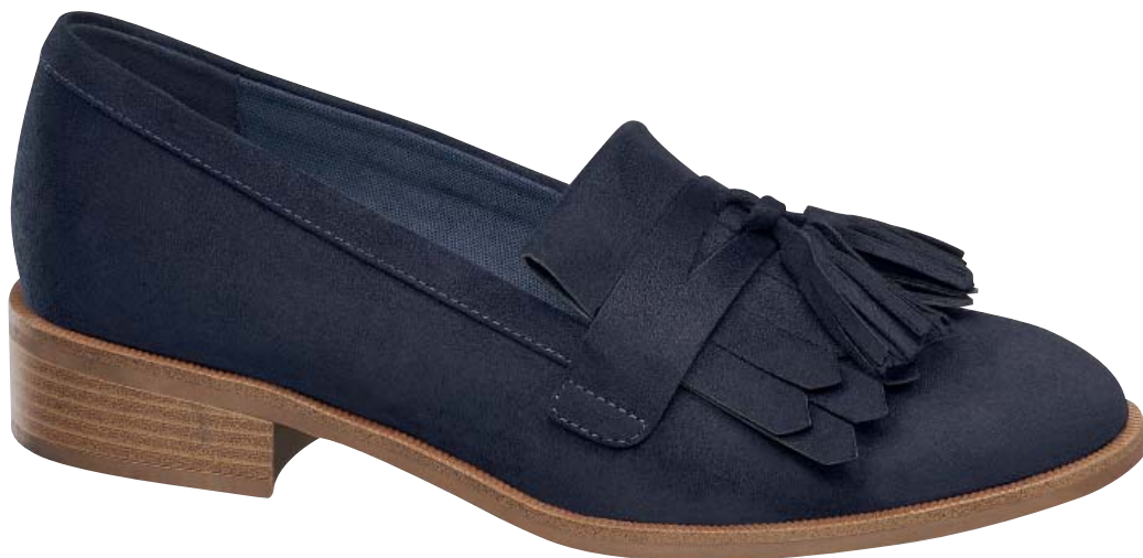
Model 1142 510 699 Kč