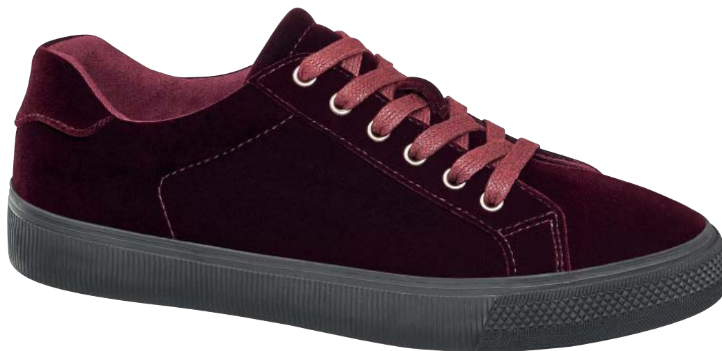
Model 1102 514 599 Kč

V kurzu je nadále sportovní obuv, tentokrát i v decentnějším barevném provedení...