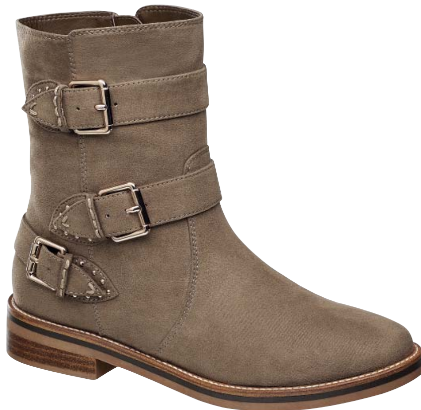
Model 1 110 520 999 Kč