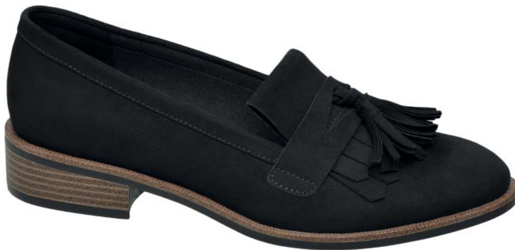
Model 1140 510 699 Kč

Mokasíny z nové kolekce jsou pohodlné, ale nerezignují ani na ženskost a eleganci...