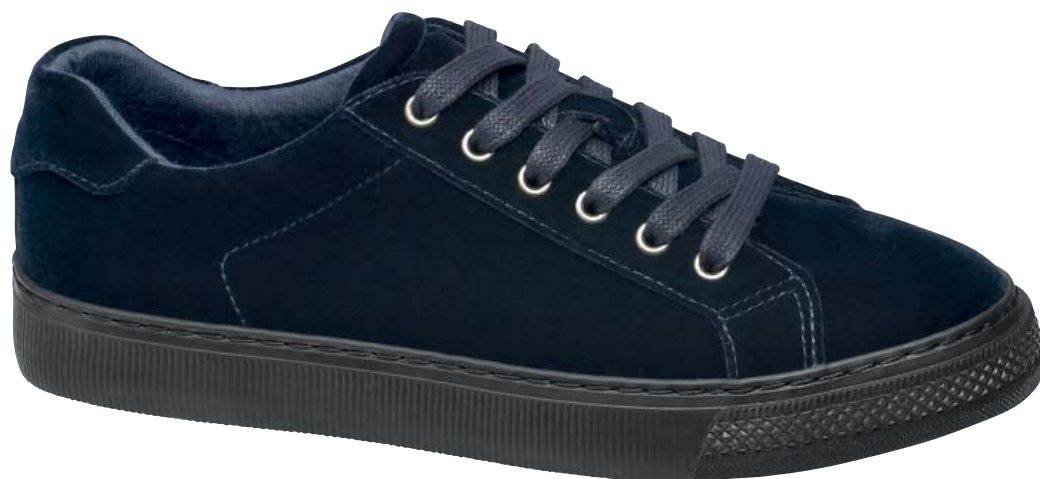
Model 1102 515 599 Kč