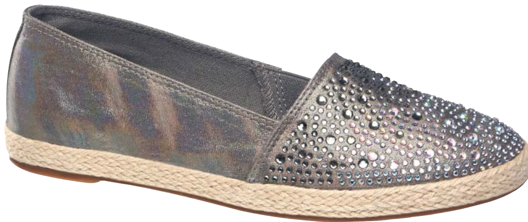
Model 1100 208 499 Kč

Když chcete zazářit na pláži i na romantické procházce městem, vsadte na třpytivý vzhled...