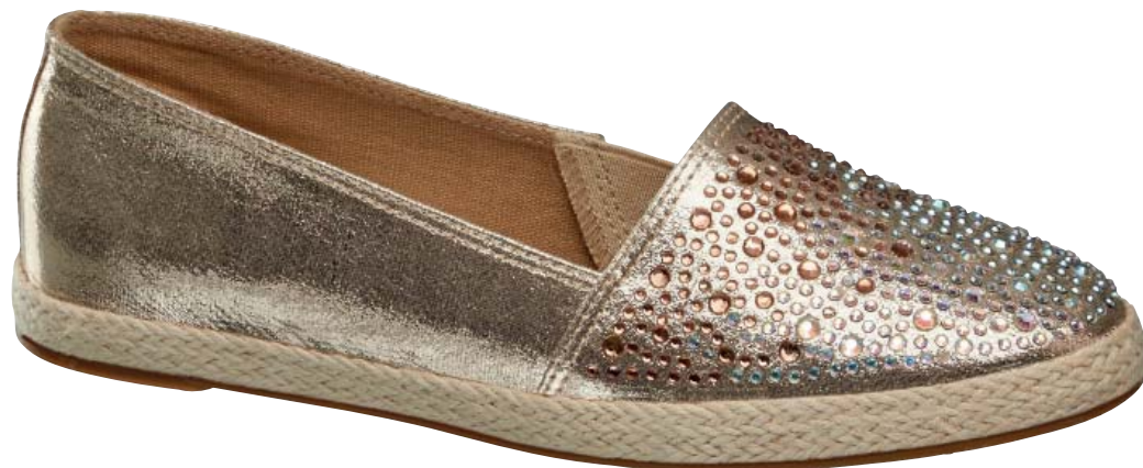
Model 1100 209 499 Kč