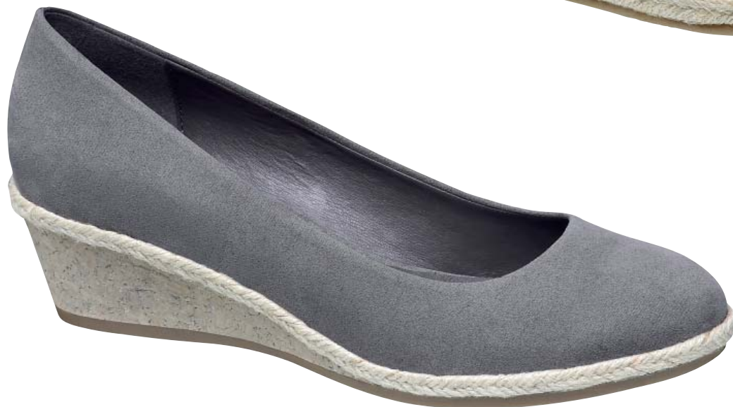
Model 1 154 460 649 Kč