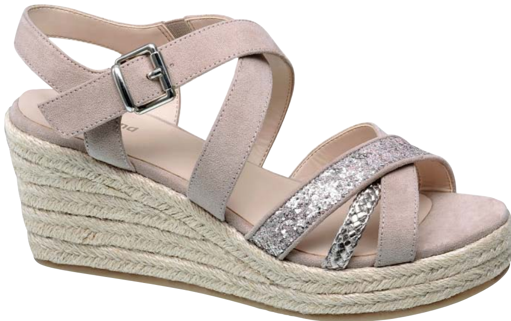
Model 1 230 455 699 Kč

Espadrilkami se inspirovala také oblíbená obuv na klínovém podpatku...