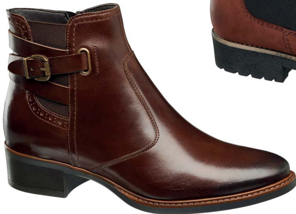
Model 1 130 307 1799 Kč