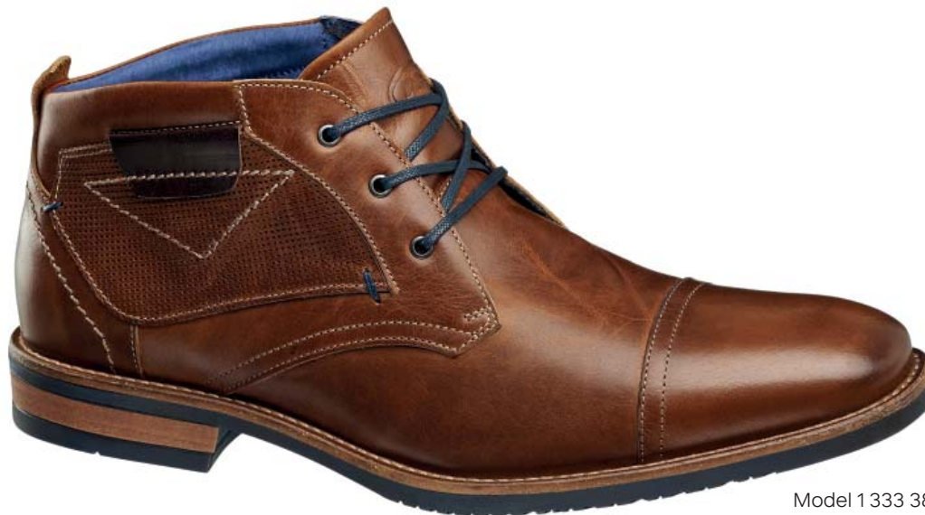
Model 1 333 381 1799 Kč

Také pánové ocení kvalitní kožené provedení obuvi...