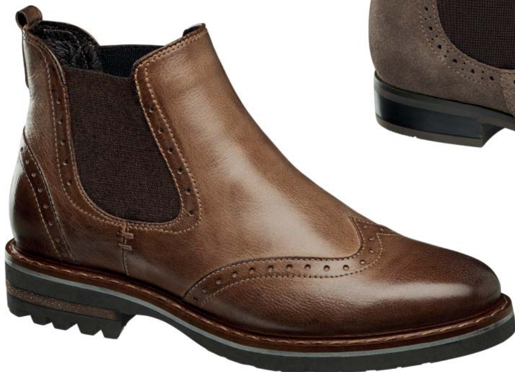
Model 1 131 305 1399 Kč

Děrovaný vzor obuv pouze zdobí, zimu k Vaším nohám nepustí...