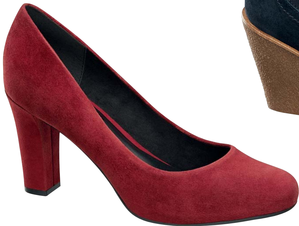
Model 1173 305 1199 Kč

V modelech z pravé kůže se bude noha cítit jako v bavlnce...