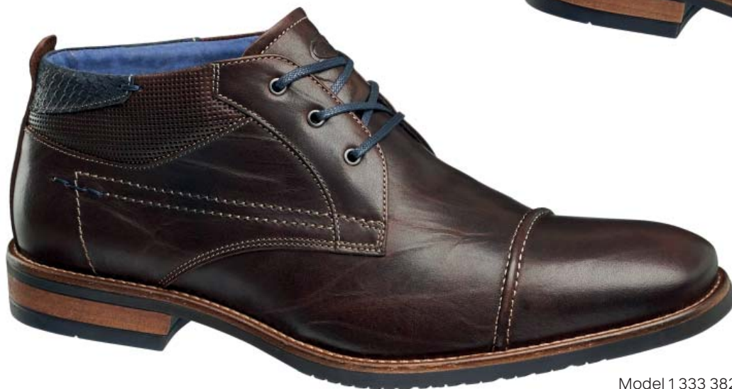
Model 1 333 382 1799 Kč

K dostání exkluzivně v internetovém obchodě a ve vybraných prodejnách.