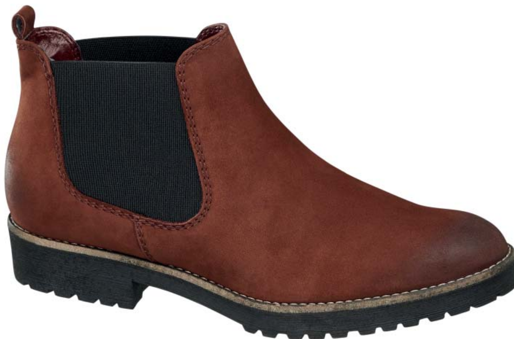
Model 1 143 375 1399 Kč

K dostání exkluzivně v internetovém obchodě a ve vybraných prodejnách.