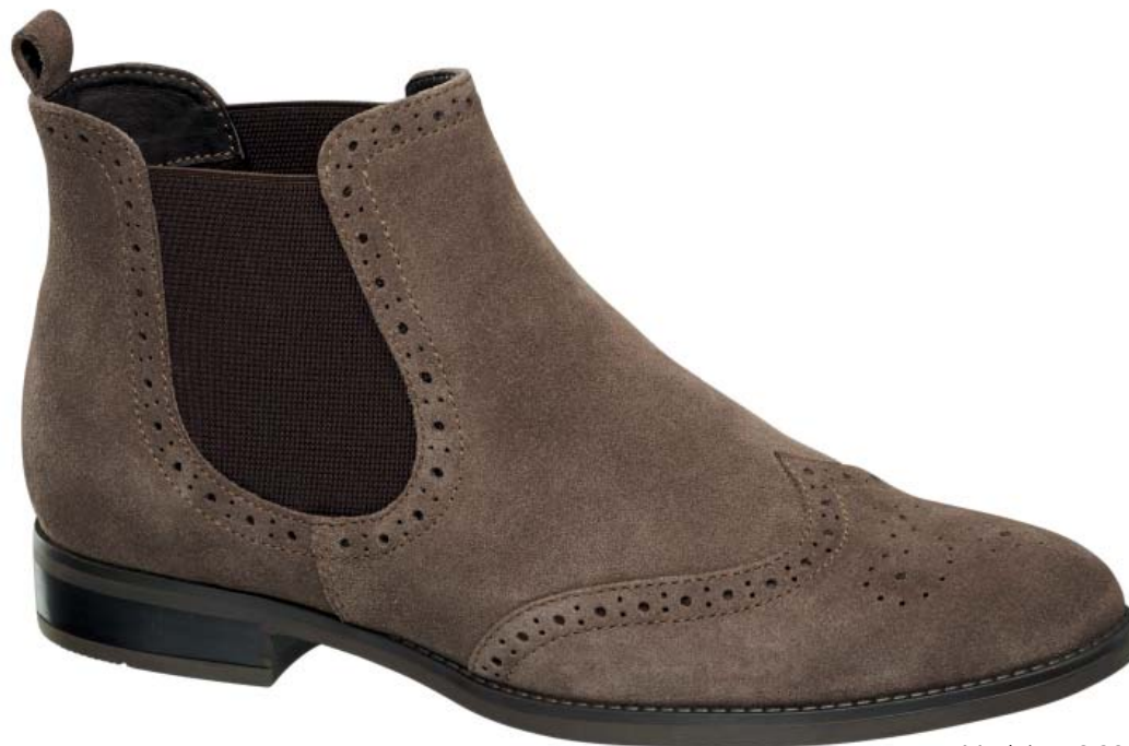
Model 1 143 360 1399 Kč

K dostání exkluzivně v internetovém obchodě a ve vybraných prodejnách.