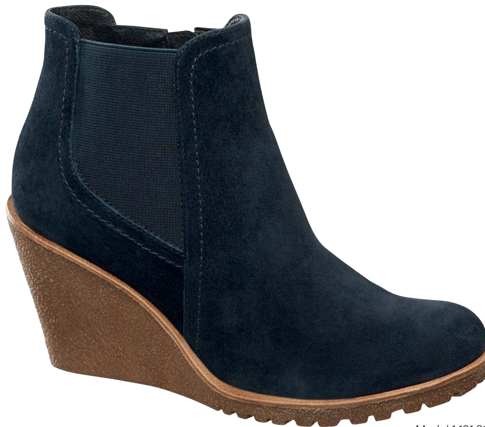
Model 1131 318 1399 Kč